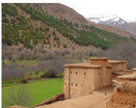
Maison des Aït Boughez

8 jours – 7 nuits – 4 jours 1/2 de marche – Facile